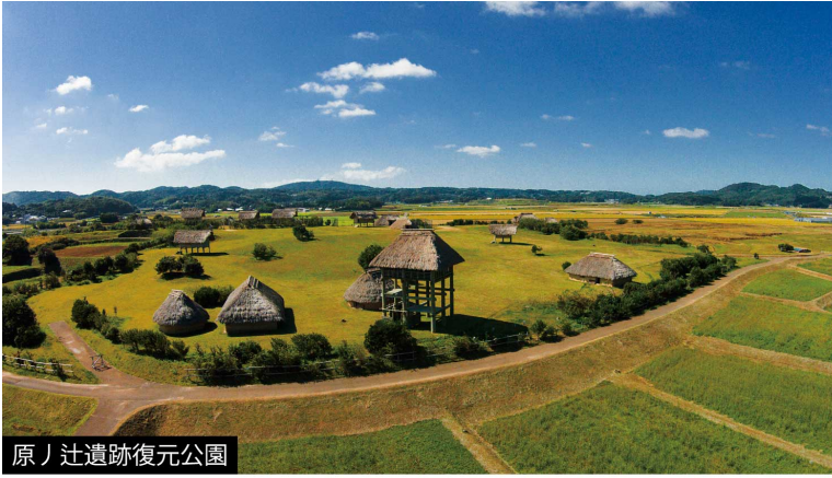
原ノ辻遺跡復元公園