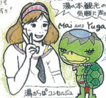
湯がらばコンセルジュ

大きなすべり台があって、こどもたちに人気の公園です。わんわん、なげめも Good Day!!